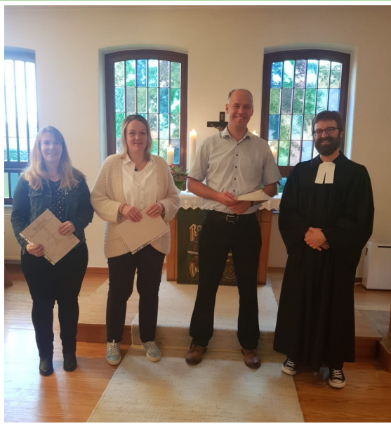
Silberne Konfirmation in Elm