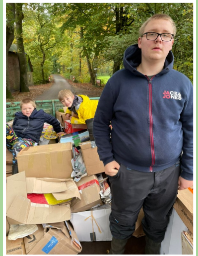
Altpapiersammlung in Bevern