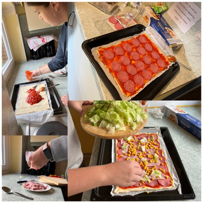
Die Evangelische Jugend Bevern-Elm-Hesedorf backt zusammen Pizza.