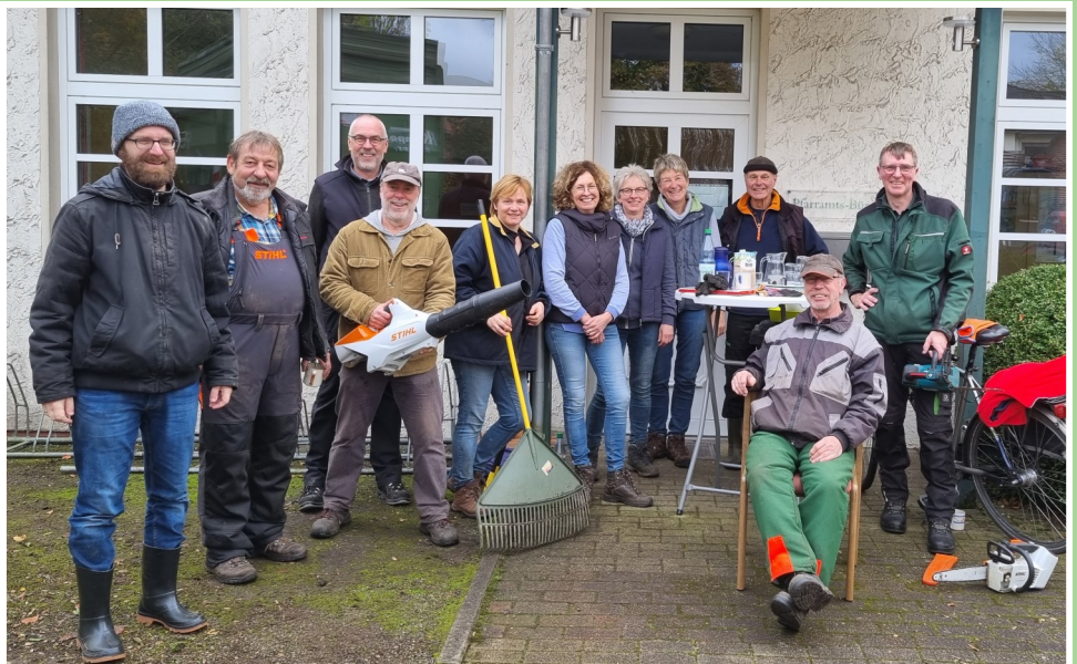
Arbeitsgruppe Außengelände Haus der Gemeinde in Bevern